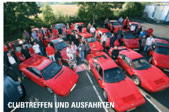
CLUBTREFFEN UND AUSFAHRTEN