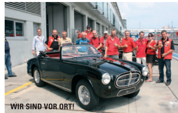
WIR SIND VOR ORT!