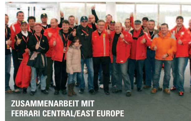
ZUSAMMENARBEIT MIT FERRARI CENTRAL/EAST EUROPE