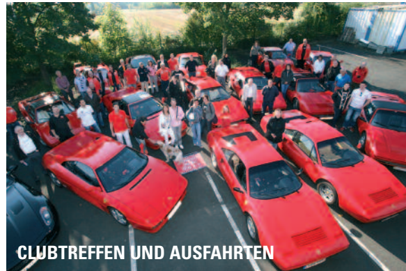
CLUBTREFFEN UND AUSFAHRTEN